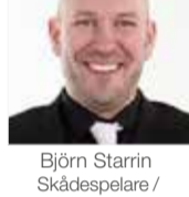
Björn Starrin Skådespelare / inspirationsföreläsare