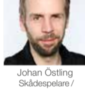
Johan Östling Skådespelare / inspirationsföreläsare